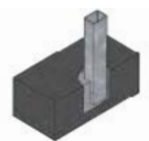
Terreno duro /pavimento Agujerear con corona