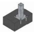
Terreno duro Platinas y tacos químicos